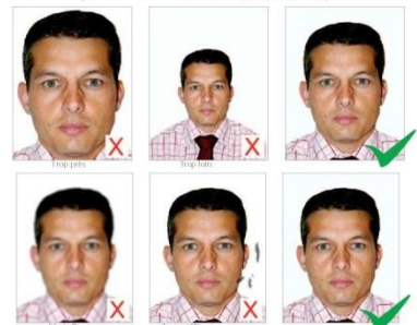
PHOTO NUMERIQUE – Impression thermique de bonne qualité à forte résolution sur du papier photographique de haute qualité

REGARD – La photo doit montrer le sujet fixant clairement l'objectif